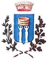
Comune di Borgolavezzaro