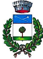
Comune di Vespolate